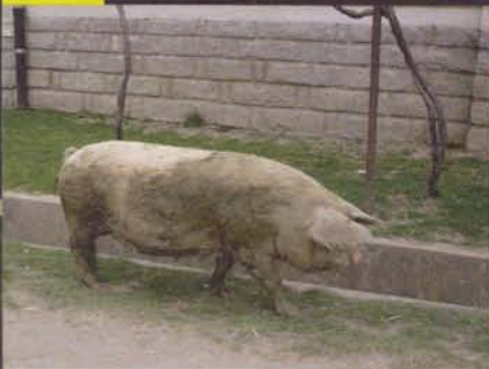
DIE GLÜCKLICHE SAU In Rumänien keine Seltenheit: frei umherlaufende Haustiere

es nicht mehr. Also ziehen wir uns gegenseitig durch den Morast. Erst reißt ein Windenseil, dann bricht auch noch eine Steckachse am 110er Landy – Weiterfahrt unmöglich! In Turda gibt es eine Werkstatt, die sich auf 4Wheeler spezialisiert hat. Dort bleibt der lädierte Land Rover zurück. Der Chef verspricht, sich um Ersatzteile zu kümmern – die Lieferung kann aber dauern. Tage? Wochen? Das weiß hier keiner so genau.