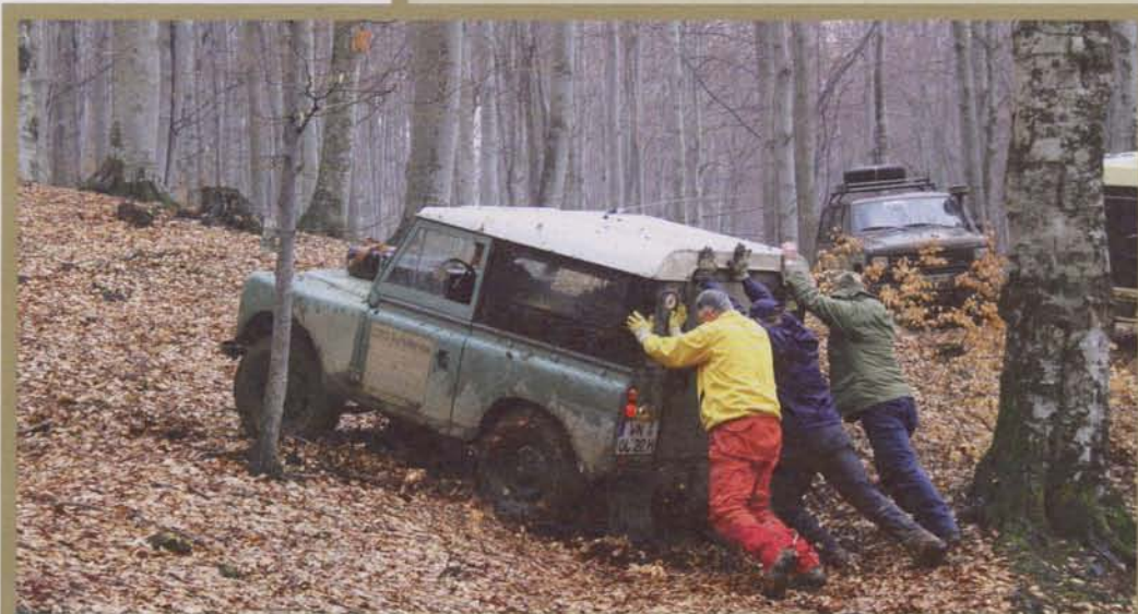
DER SCHWIERIGE WEG

Pferd und Wagen kommen auch dort durch, wo für Autos oft Schluss ist