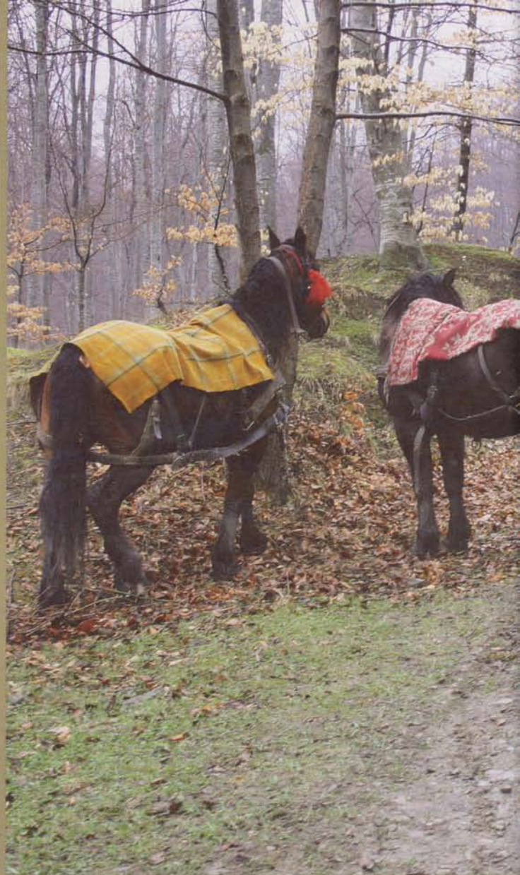
DAS ÜBLICHE GESPANN